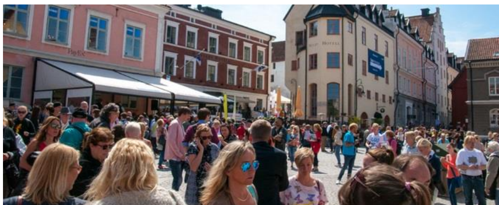
Almedalsveckan