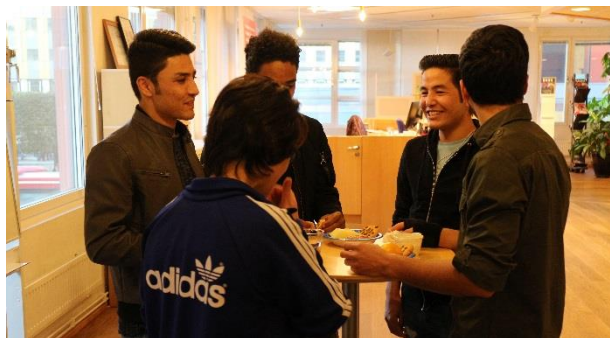
På bilden: Medlemmar i Påverkansrådet inleder en av sina träffar med fika och samtal.

Sammantaget känns det som en bra start på terminen och gruppen tuffar på med energi och förväntan in i höstens kyla!