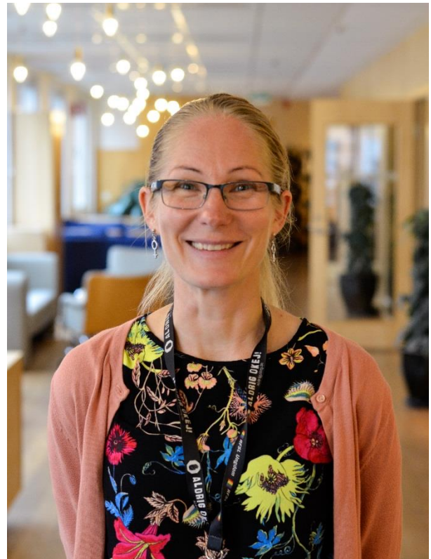
Bild: Projektledare Sandra Akiwumi-Lundstedt

Vi svarar lördag- måndag kl 16-18. Vi är unga som stöttar andra unga.