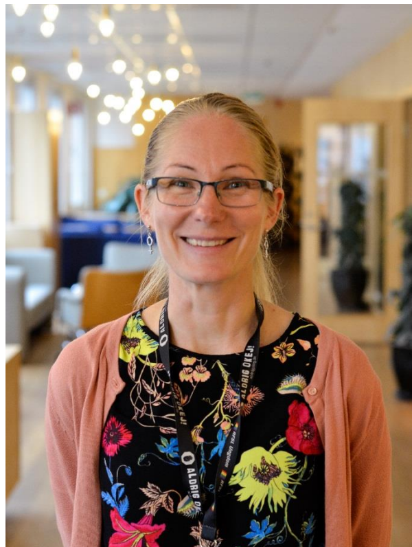
Bild: Projektledare Sandra Akiwumi-Lundstedt

Vi svarar lördag- måndag kl 16-18. Vi är unga som stöttar andra unga.