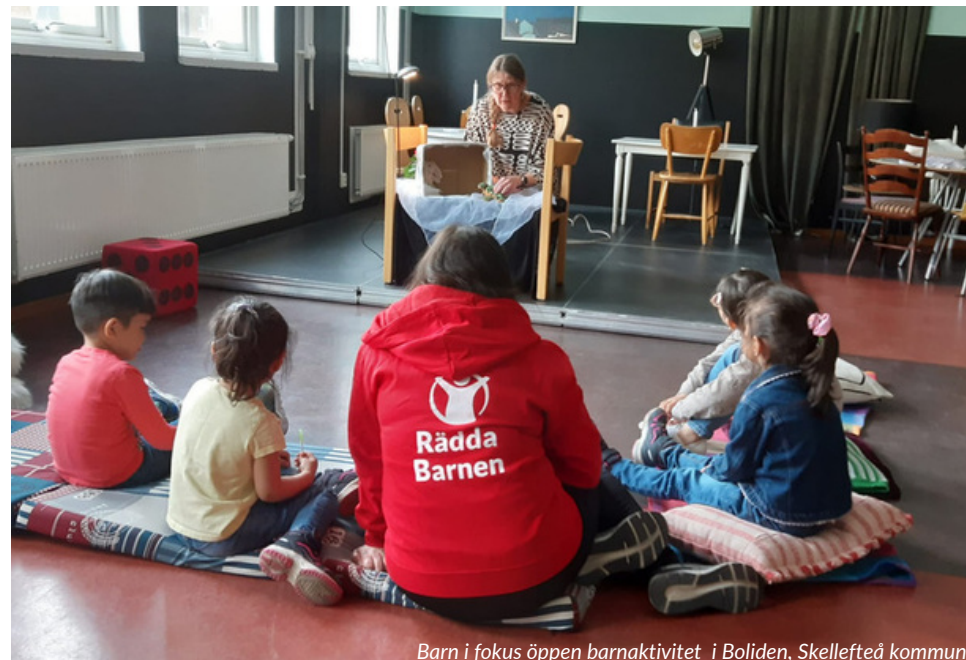
Barn i fokus öppen barnaktivitet i Boliden, Skellefteå kommun

Efter flera våldshändelser i bostadsområden i Haninge och Kalmar kommun har Rädda Barnen utbildat kommunpersonal i "När något har hänt. Hur kan vi stötta barn i en tid av mycket oro?" På båda platserna deltog kommunens operativa personal som möter barn och ungdomar i sitt arbete. I Haninge kommun har även föräldrar tagit del av utbildningen.