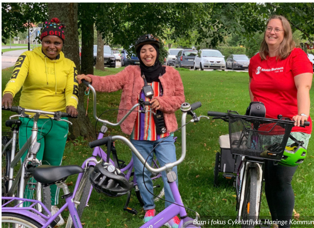
Barn i fokus Cykelutflykt, Haninge Kommun

Föräldrar eller andra vårdnadshavare har huvudansvaret för sina barns uppväxtförhållanden, livsvillkor och för att varje barn får sina rättigheter tillgodosedda. Relationen mellan barn och föräldrar kan stärkas genom att göra aktiviteter tillsammans och när föräldrar kan vara delaktiga i barnets aktiviteter. Att göra saker som får en att må bra, skratta och hitta vänner är hjälpsamt särskilt när livet är eller har varit svårt.