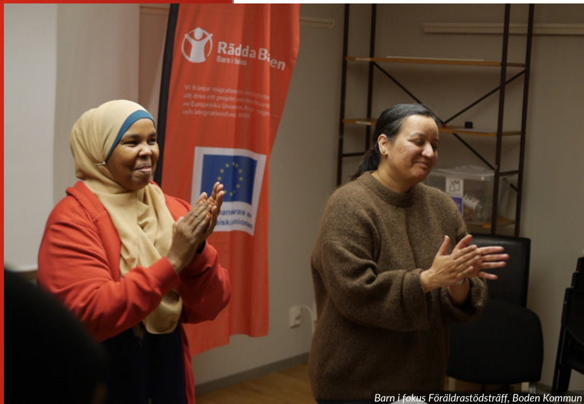
Barn i fokus Föräldrastödsträff, Boden Kommun

Genom dialog och diskussioner blir föräldrar delaktiga och får hjälp att sätta ord på sina frågor eller oro, om exempelvis barnuppfostran, svenska skolsystemet, elevhälsa och migrationsprocesser. Regelbundenheten, möjligheter till dialog och individuellt stöd gör att föräldrastödet blir mer än samhällsinformation och bidrar även till nya relationer och känsla av tillit och trygghet.