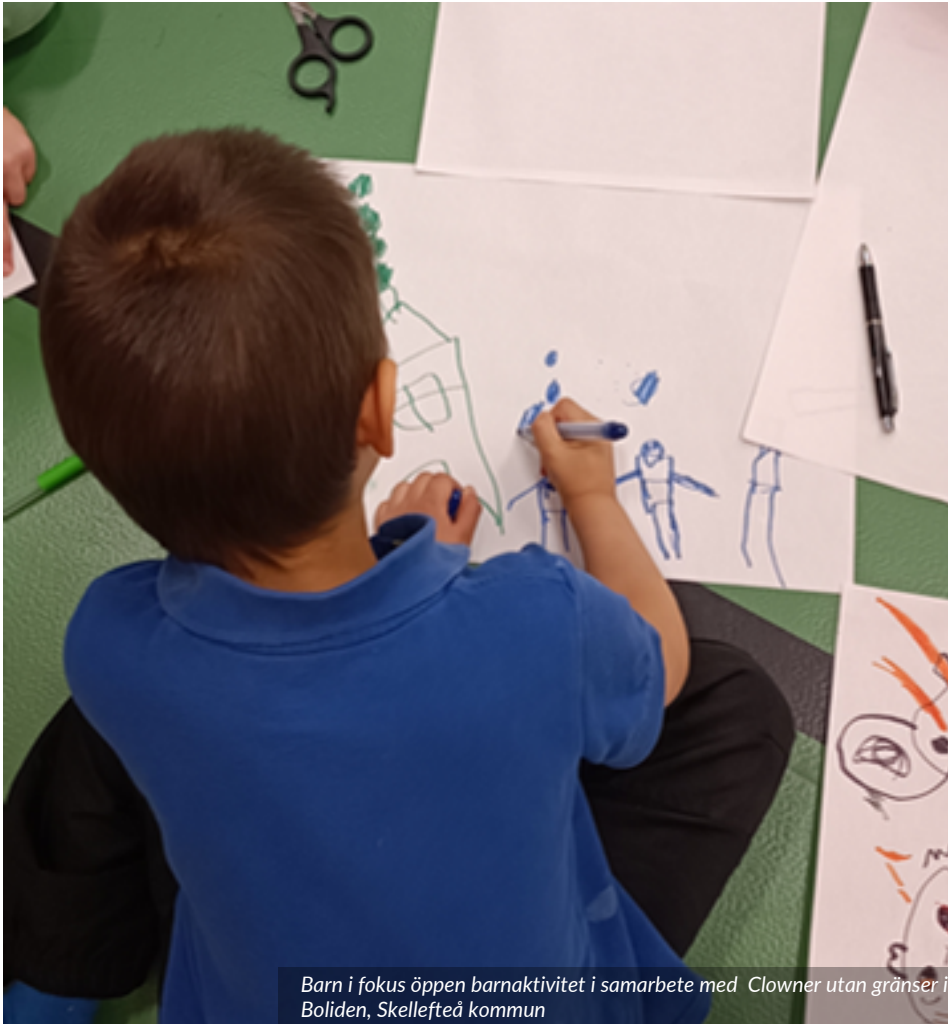
Barn i fokus öppen barnaktivitet i samarbete med Clowner utan gränser i Boliden, Skellefteå kommun