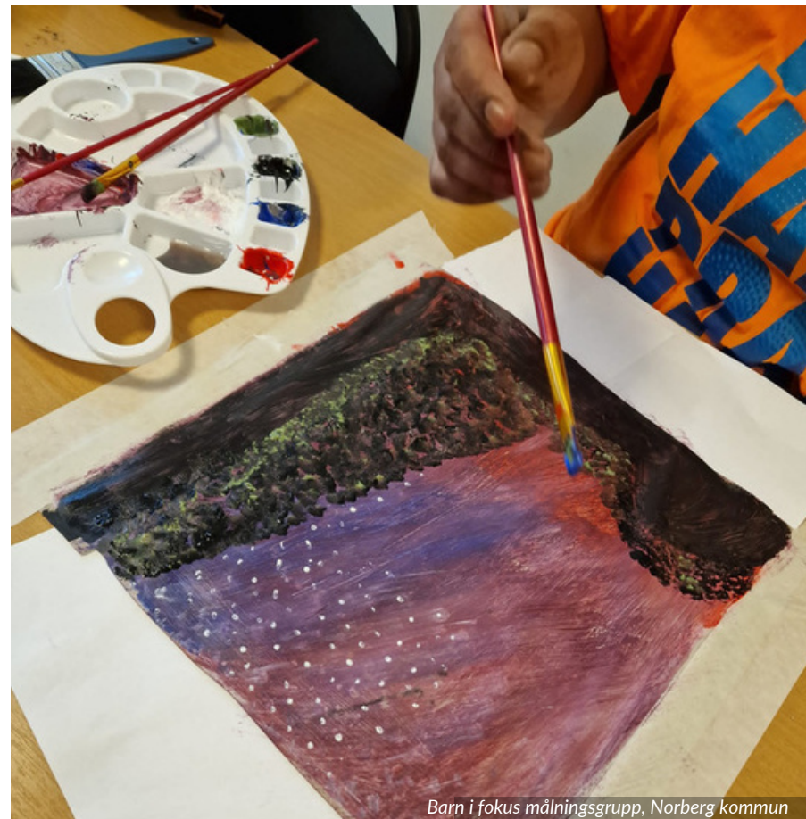
Barn i fokus målningsgrupp, Norberg kommun

I likhet med Norberg har föräldragrupper i Boden resulterat i "barnledig fredag", en självorganiserad aktivitet för mammor. Samtidigt finns en Barnvänlig plats för de yngre barnen. "Barnledig fredag" innebär att det varje fredag är en deltagare som leder en aktivitet med fokus på hälsa och egenmakt, det kan vara allt från yoga till bakning.