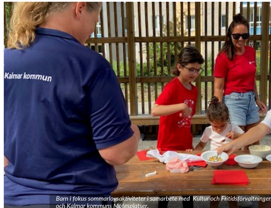
Barn i fokus sommarlovsaktiviteter i samarbete med Kultur och Fritidsförvaltningen och Kalmar kommuns Mötesplatser.

I Skellefteå har Rädda Barnen tillsammans med Svenska Kyrkan och kommunen genomfört sommarlovsaktiviteter. Ytterligare sommarlovsaktiviteter genomfördes även tillsammans med Clowner utan gränser. Fokus för dagarna var lättsamma rörelseaktiviteter och cirkusaktiviteter. När samarbetspartner håller i aktiviteter finns Rädda Barnen med som extra vuxna för att fånga upp de barn som behöver lite extra stöd, en paus eller en lugnare aktivitet.