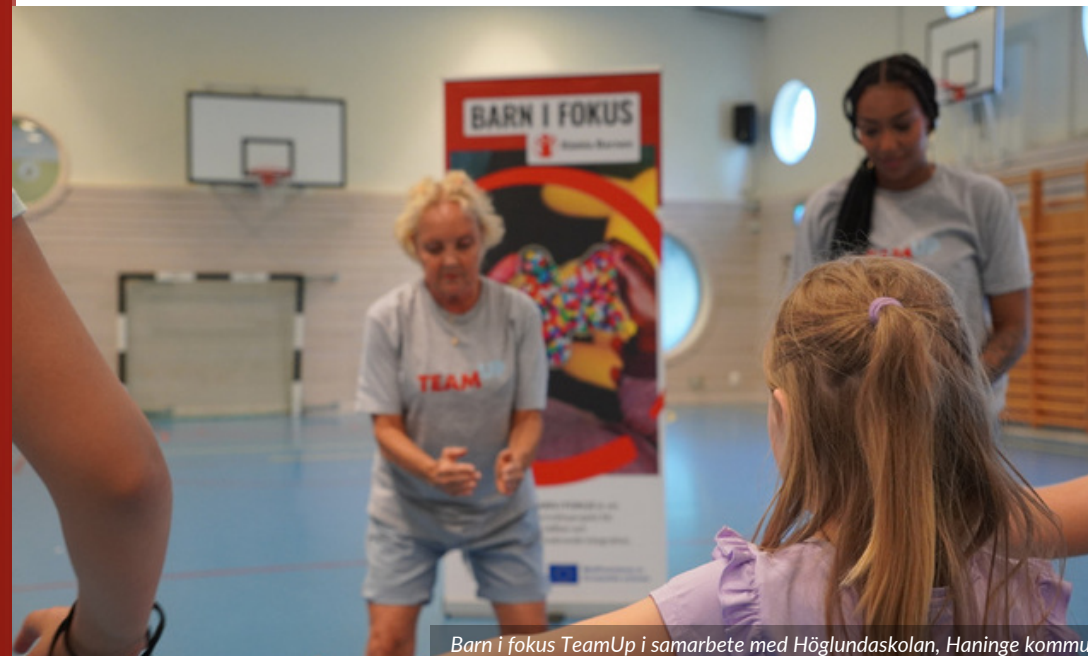
Barn i fokus TeamUp i samarbete med Höglundaskolan, Haninge kommun