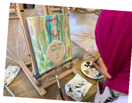
Bilder från aktivitetshelgen.